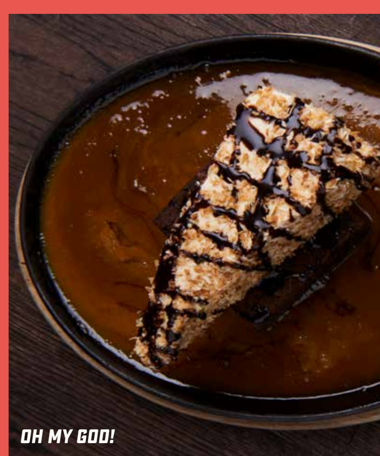
OH MY GOD!