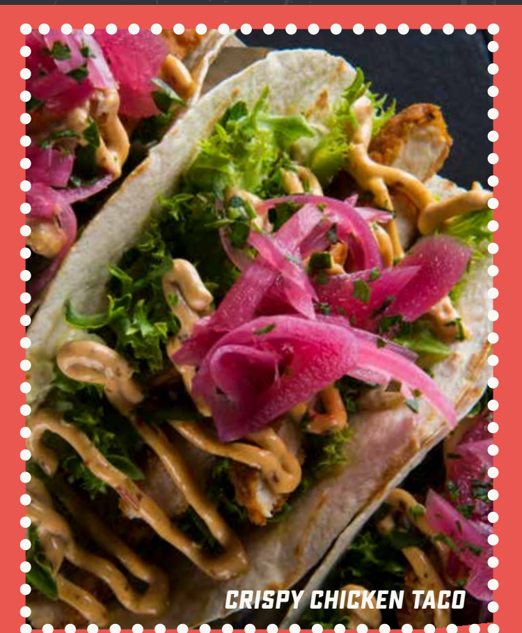
CRISPY CHICKEN TACO